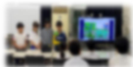
生活集会での中間報告の様子

夏休みまでの期間でさらに子供たちが成長できますよう、ぜひ見守りのほどよろしくお願いいたします。