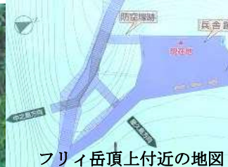
フリイ岳頂上付近の地図