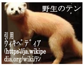
野生のテン

動物全般が好きなのでどうしてもテンを研究したいというわけではありませんでした。トカラ列島は研究者にとつて未開の地です。研究するなら「外来種のこと」と「離島」という希望があったので、研究者が少ない口之島を選びました。 ・テンが持ち込まれた目的は何ですか。