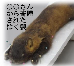
贈り物として持ち込まれたテンのクッキー

他の島では、イタチがネズミの駆除のために持ち込まれました。また、新潟の佐渡島では、ノウサギが木をかじって生じる農林被害を防ぐためテンが持ち込まれました。おそらく、ネズミの駆除のために持ち込まれたと思えます。 ・テンはこの島には何匹いますか。 何匹いるかは調べなかつたので分かりません。しかし、密度でいうとかなり多いです。一キロメートル歩くと、他の地域は三〜五匹のテンが落ちていますが、口之島は十四匹のテンを発見できます。これはかなり多いです。 ・他の島にもテンはいらっしゃいますか。 トカラ列島には口之島しかいません。長崎の対馬や兵庫県の淡路島には元々います。人間の都合で持ち込まれたため、新潟の佐渡島などにもいます。