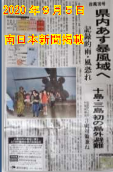
2020年9月5日 南日本新聞掲載

Two years ago, on September 5, a large typhoon struck Kuchinoshima, and the Self-Defense Forces evacuated the island by helicopter. I was worried about my first helicopter and the family I was left behind. Also, everyone was confused because it was an emergency day. And this year, an off-island evacuation drill was conducted assuming an off-island evacuation by boat. Like the typhoon two years ago, you never know when a big typhoon will come. In order to be able to respond calmly at any time, I would like to value each evacuation drill and be able to take measures against disasters on a daily basis. And I want to be able to protect my own life. {3rd year Junior High School Student}