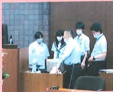
村ミニ議会前の事前打合せの様子

どちらも活動を楽しみ、隔てた島どうしの交流も図ることができ充実した日を過ごしました。