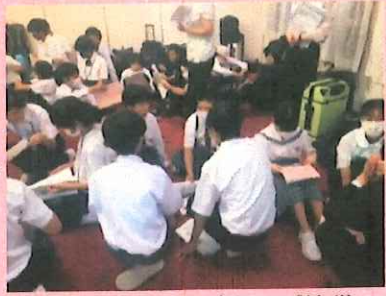
7島が混在したグループ協議