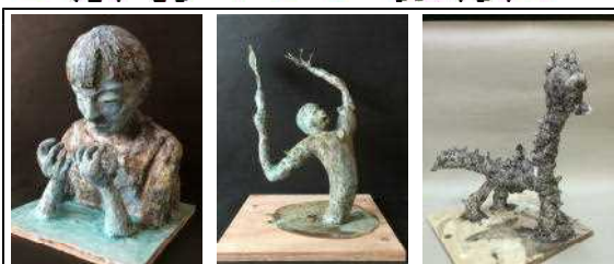
中1 「妹」 中2 「決めろ!! 弾丸スマッシュ」 小4 「ぼくのキリン」

この作品展は県内から1200点以上の応募作品があり、その中から、特別賞がわずか10点(小中各1名)、特選は各学年10名程度しか選ばれません。小学生から中学生まで、全員が取り組み、休日返上で作品作りに取り組んでいました。「やればできる」を実証し、今後の励みになったことでしょう。3人は授賞式に参加します。また、併せて『学校賞』も受賞しました。