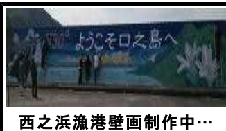
西之浜漁港壁画制作中...