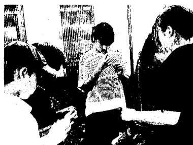
収穫した島バナナを食べる子どもたち

山海留學生として島外から児童生徒を受け入れている平島小中学校では、豊かな自然を生かした教育が1年を通して実践されている。島の特産品である大名タケノコの収穫や、港での魚釣りなどだ。