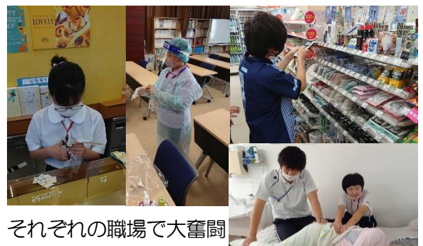
それぞれの職場で大奮闘