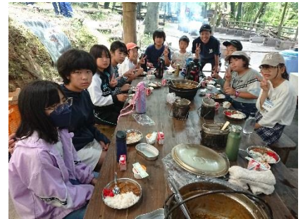
野外炊飯も協力して大成功

今後の進路選択における、大きなヒントになる職場体験になったと思います。ここでの体験は、これから児童生徒がまとめ学習を行う予定になっています。