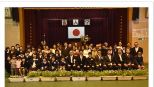
多くの島民の方々がお祝いしてくださ り、華やかな入学式となりました！